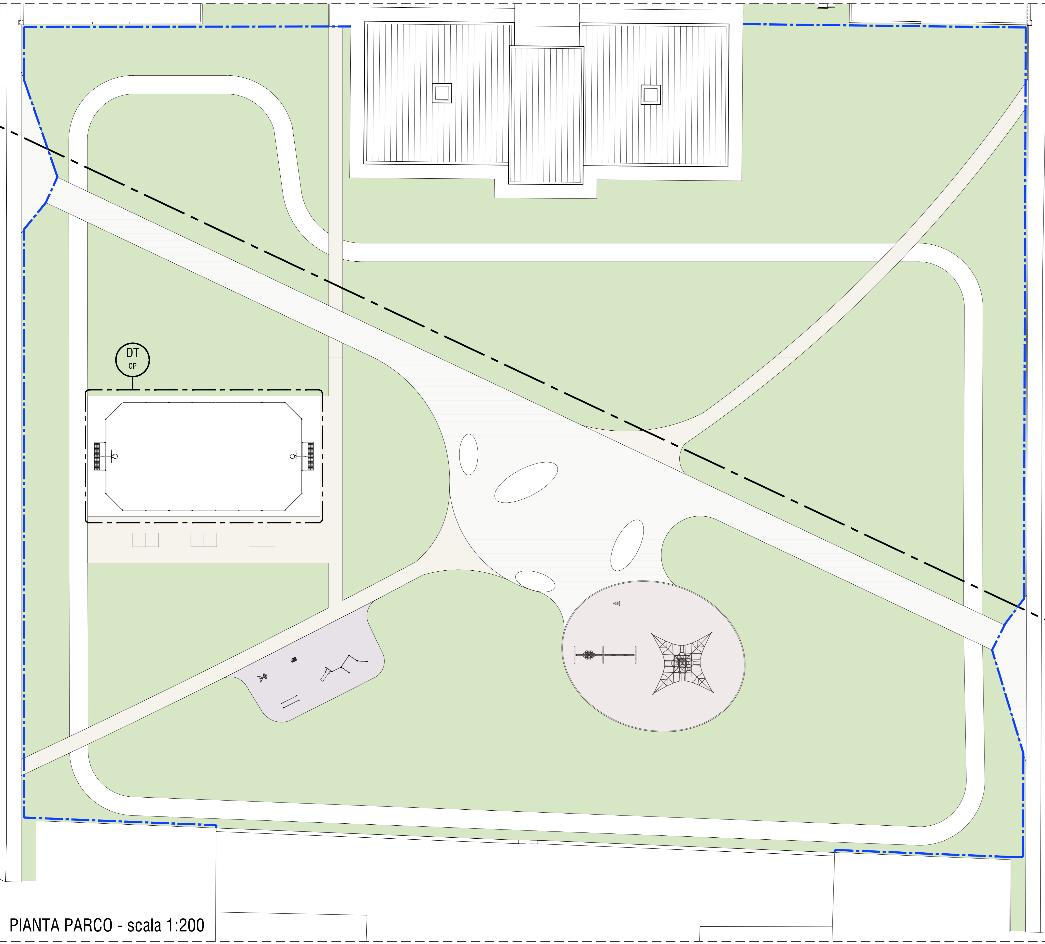
PIANTA PARCO - scala 1:200