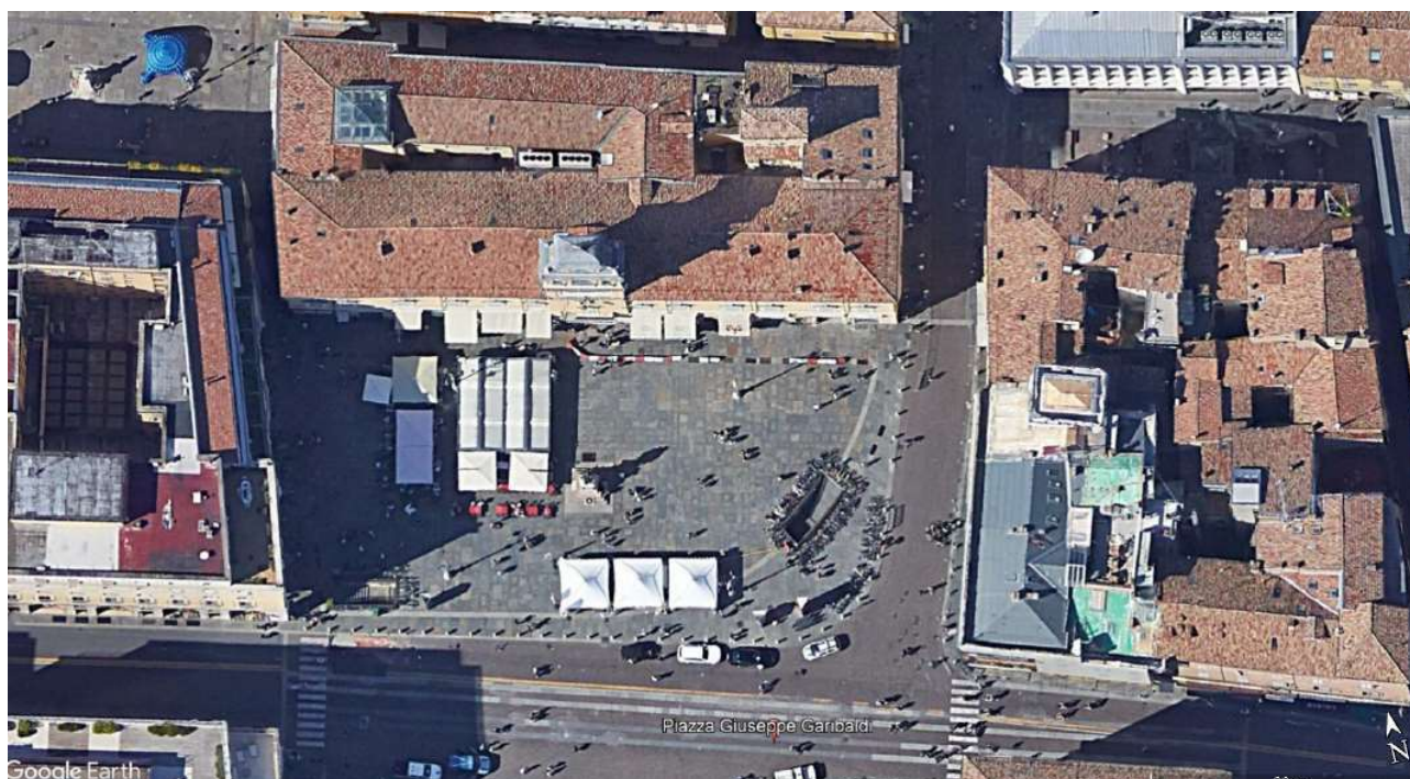
Inquadramento aereo dell'area