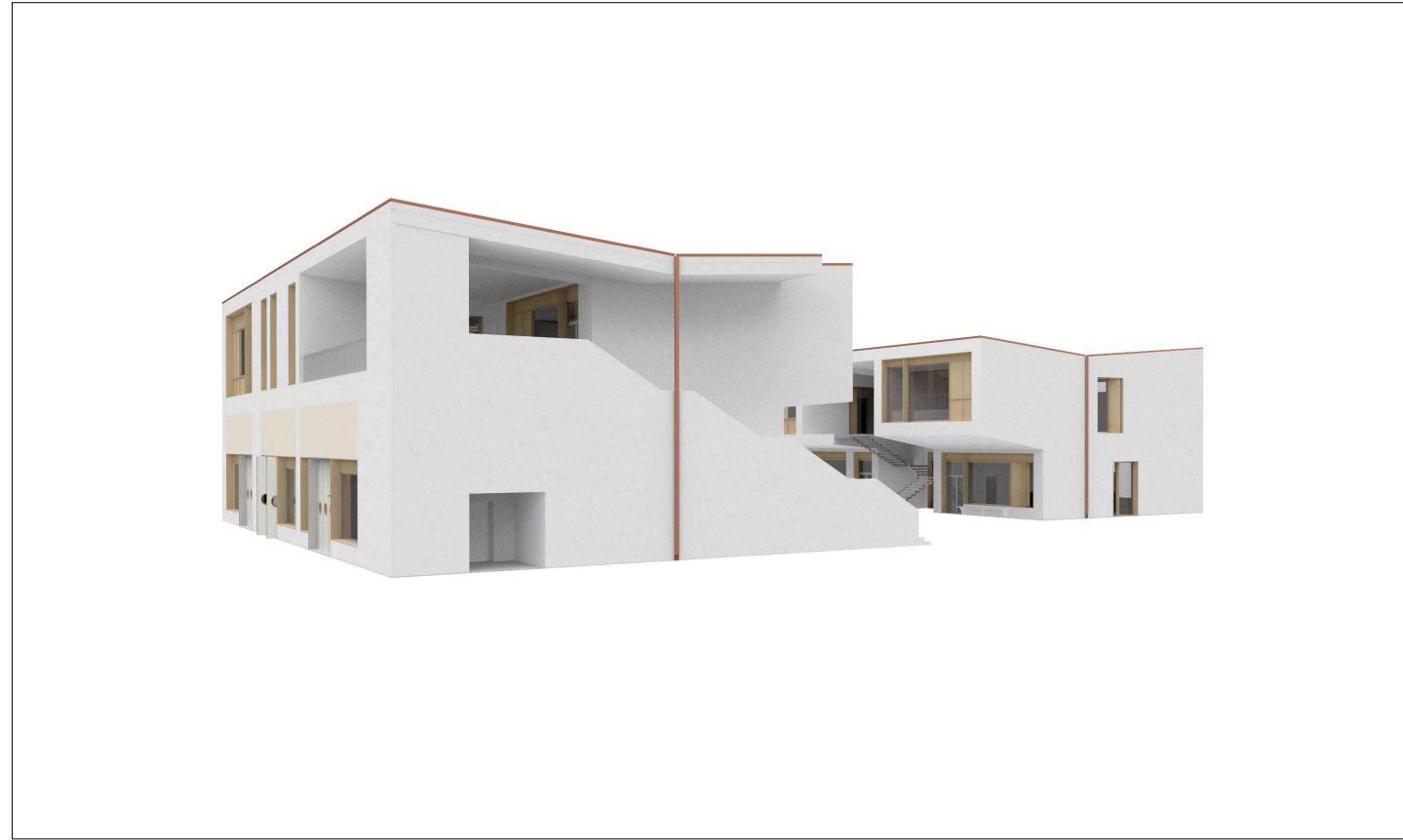
Edificio 1 ed Edificio 2 - vista dal lato corto dell'Edificio 1