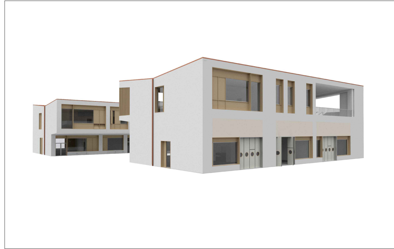
Edificio 1 ed Edificio 2 - vista dal retro dell'Edificio 1