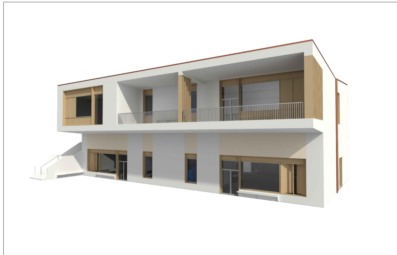
Edificio 1 - vista del fronte principale