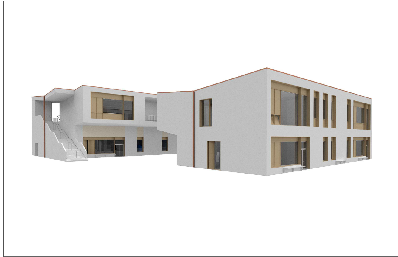
Edificio 1 ed Edificio 2 - vista d'insieme dall'ingresso