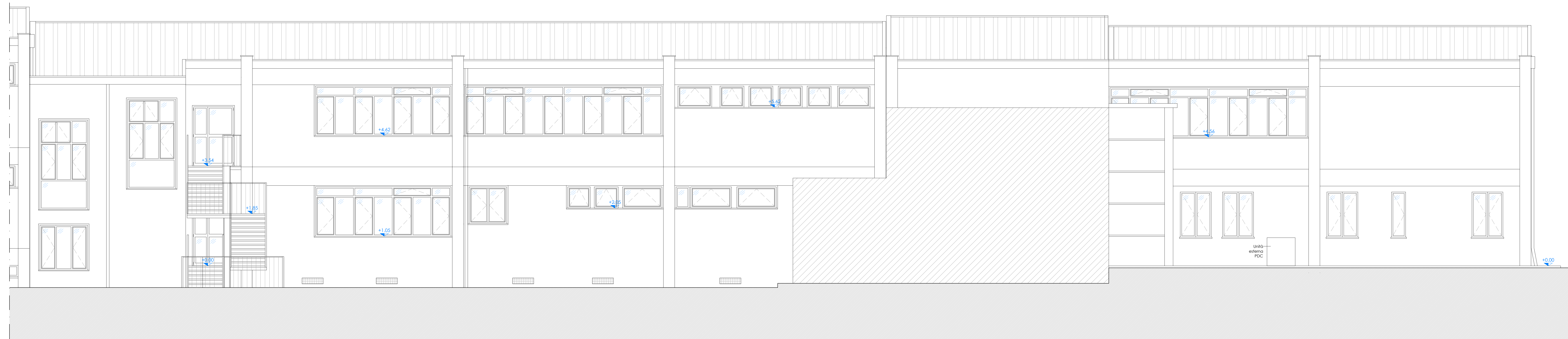
PROSPETTO OVEST BLOCCO B e A