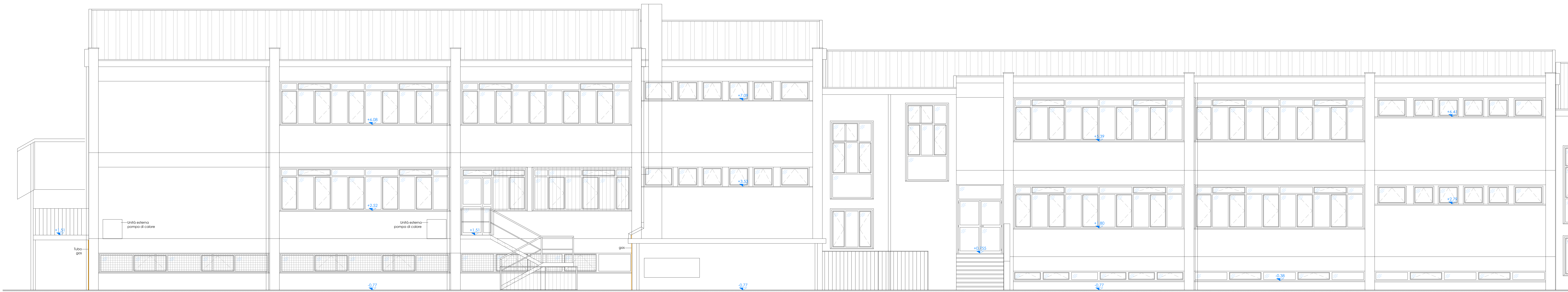
PROSPETTO OVEST BLOCCO DE e C