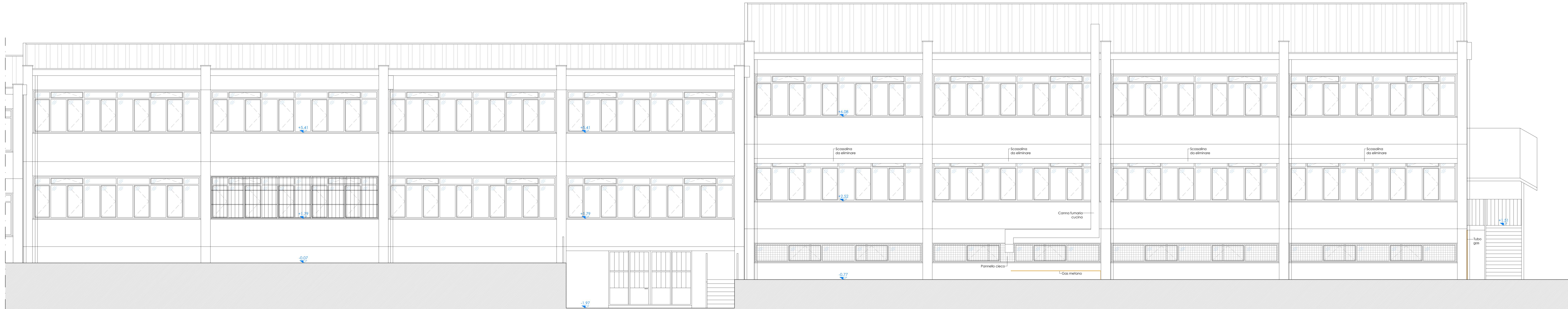
PROSPETTO EST BLOCCO C e DE