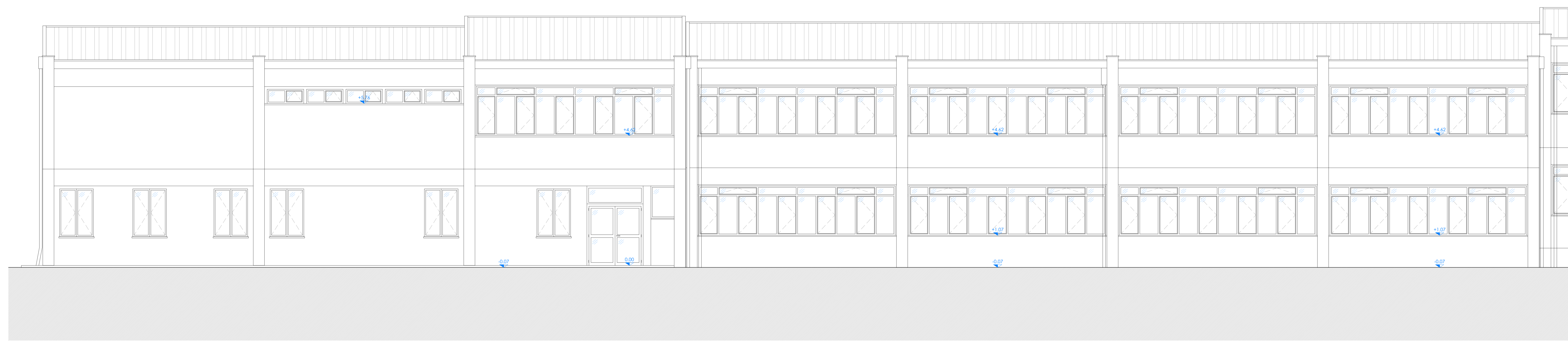
PROSPETTO EST BLOCCO A e B