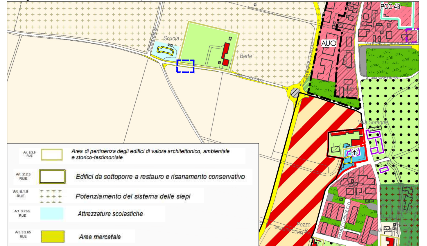
ESTRATTO R.U.E. Q.re Vigatto - Strada Ritorta - Comune di Parma (PR)