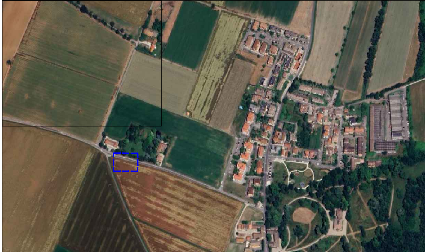
ORTOFOTO AREA D'INTERVENTO Q.re Vigatto - Strada Ritorta - Comune di Parma (PR)