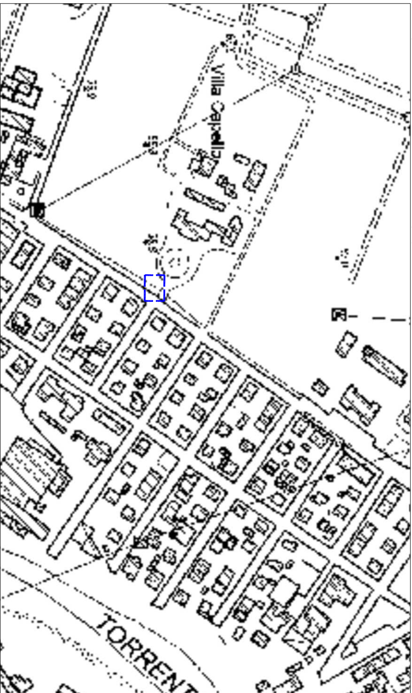
scala 1 : 5000