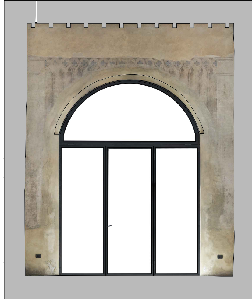
ORTOFOTO_ Prospetto Sud