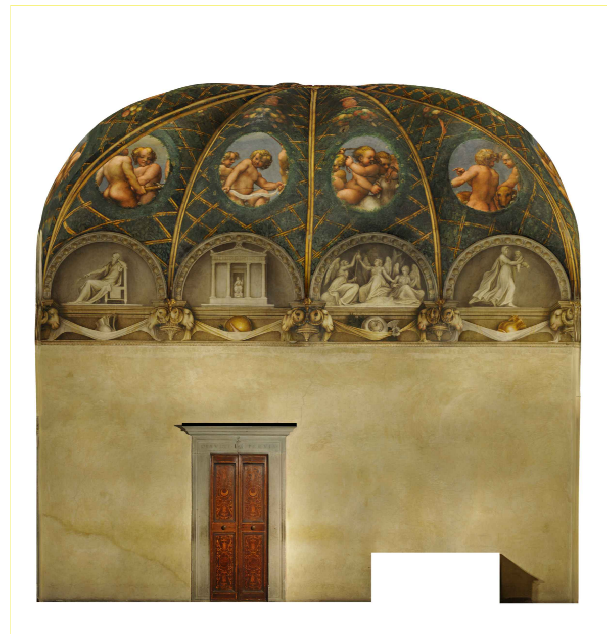
ORTOFOTO_ Prospetto Sud