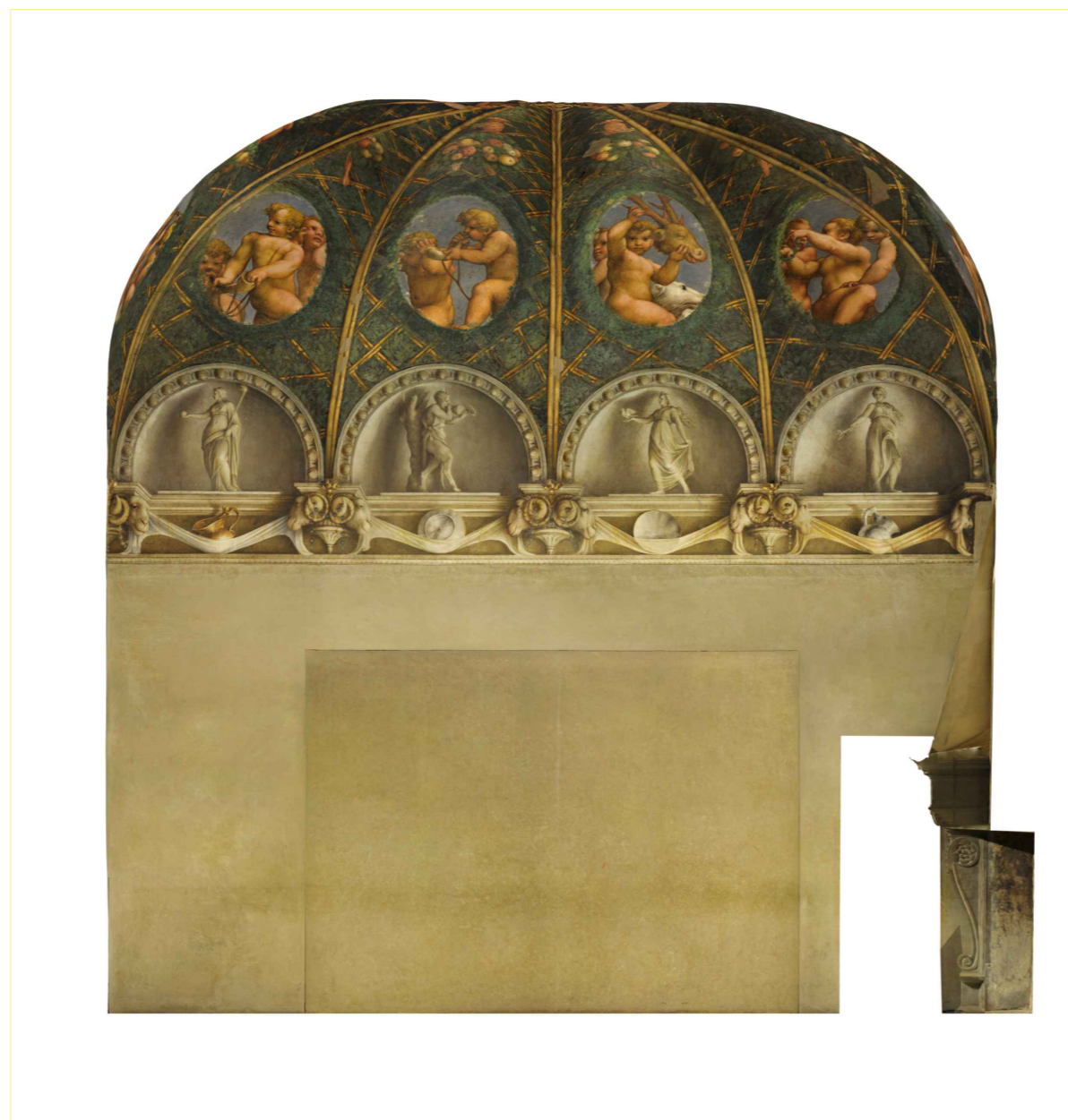
ORTOFOTO_ Prospetto Ovest