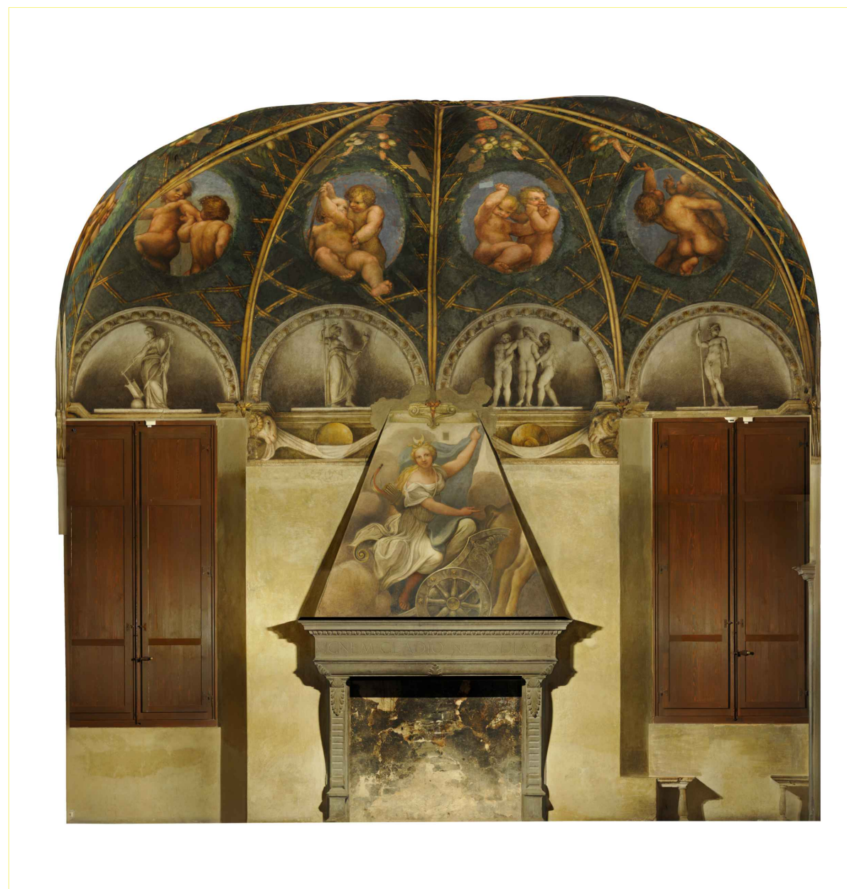
ORTOFOTO_ Prospetto Nord