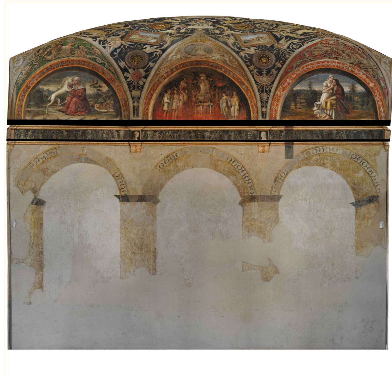
ORTOFOTO_ Prospetto Sud