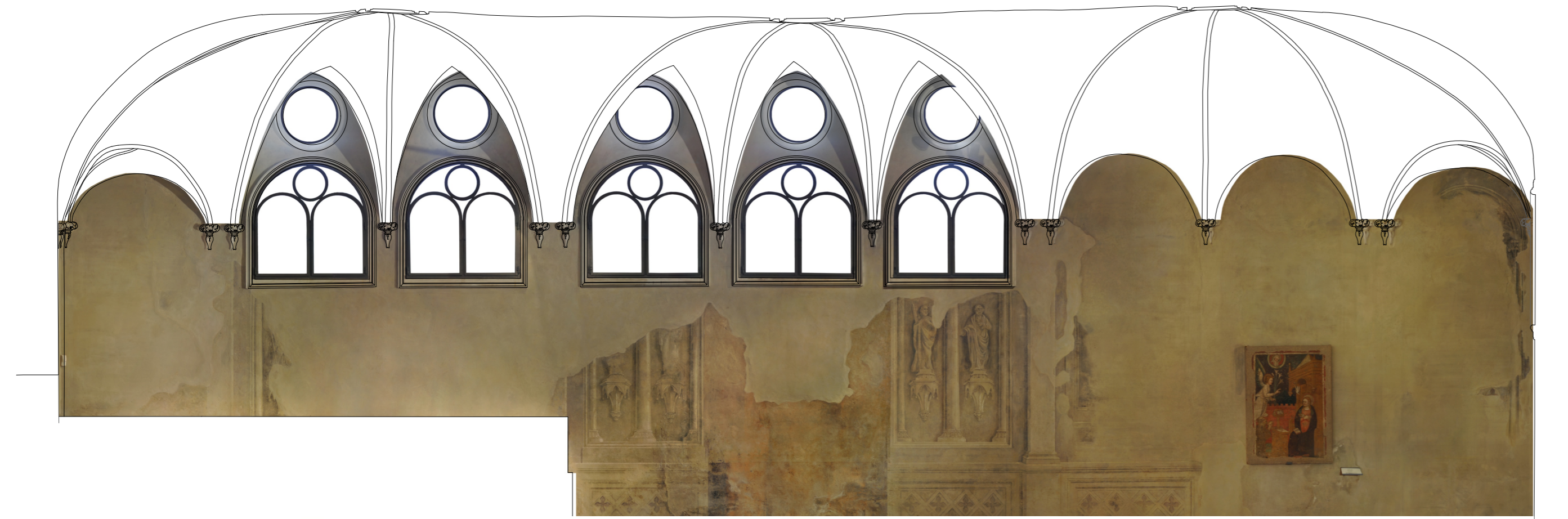
ORTOFOTO_ Prospetto Sud