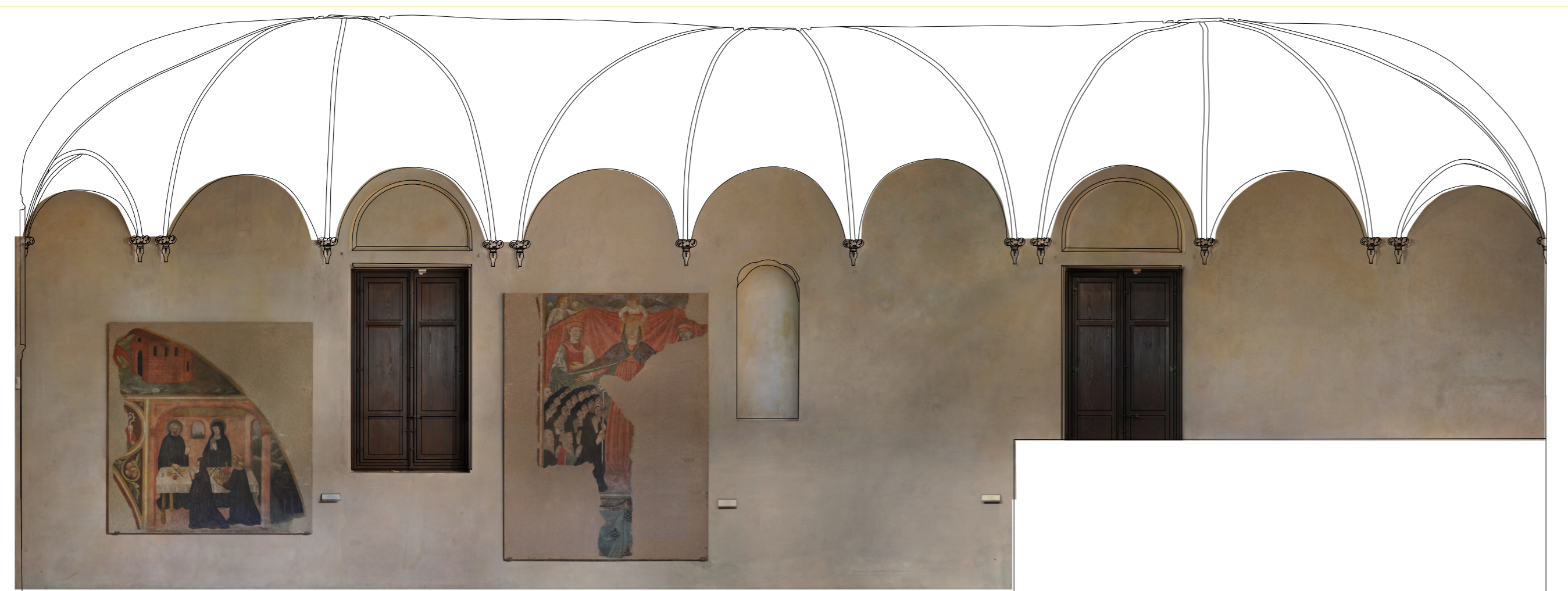
ORTOFOTO_ Prospetto Nord