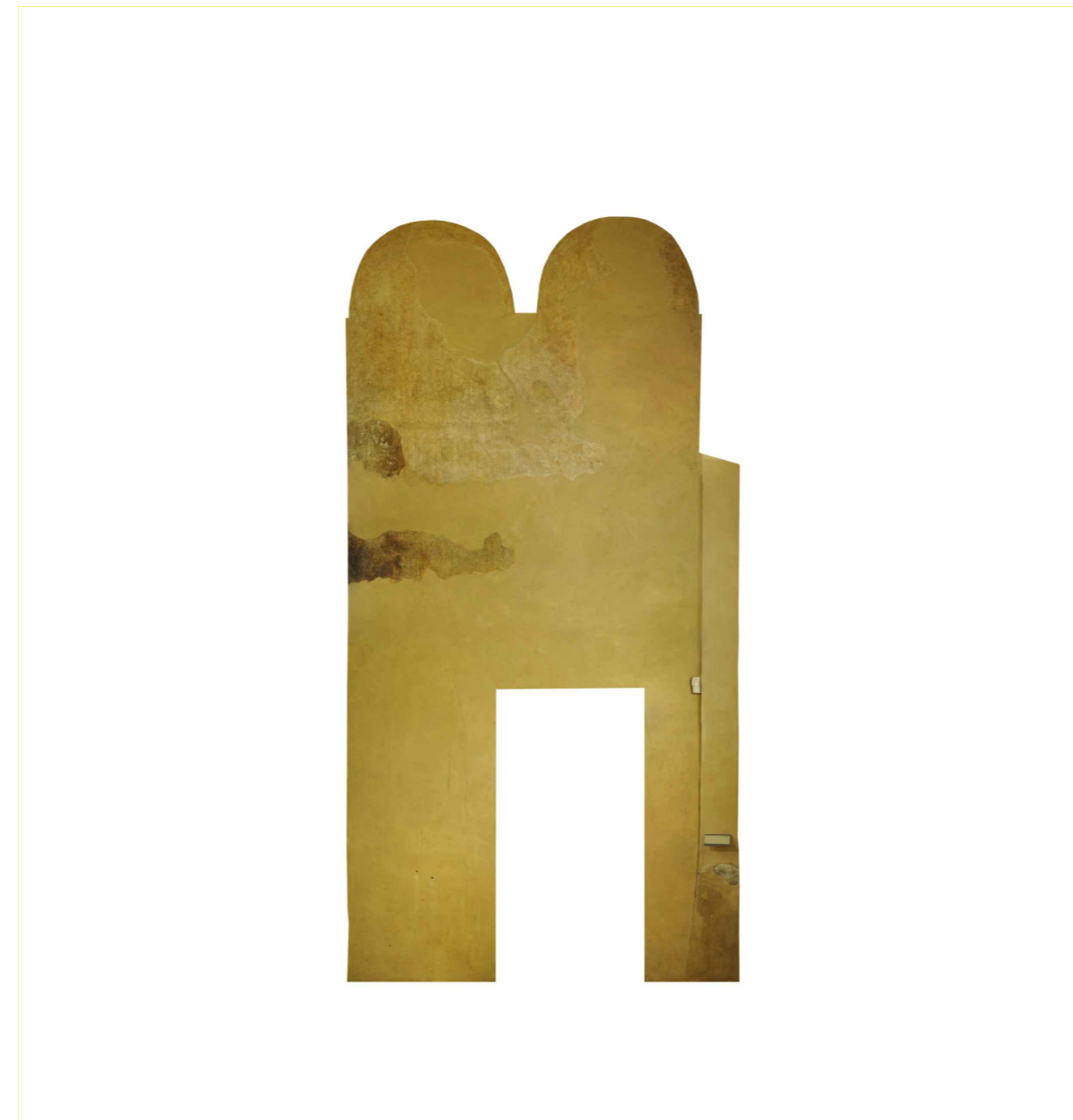
ORTOFOTO_ Prospetto Est