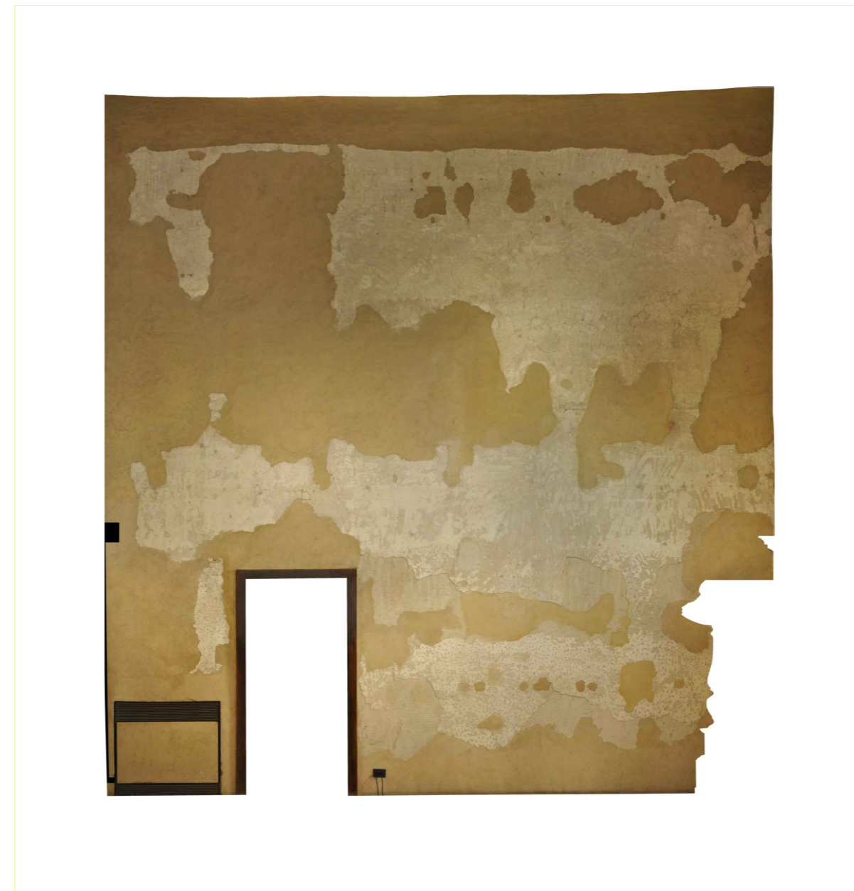
ORTOFOTO_ Prospetto Nord