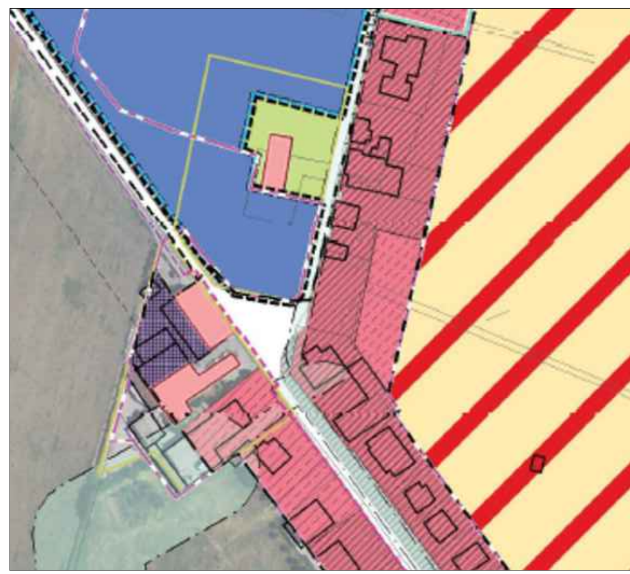
R.U.E. - Estratto foglio 15-II-E