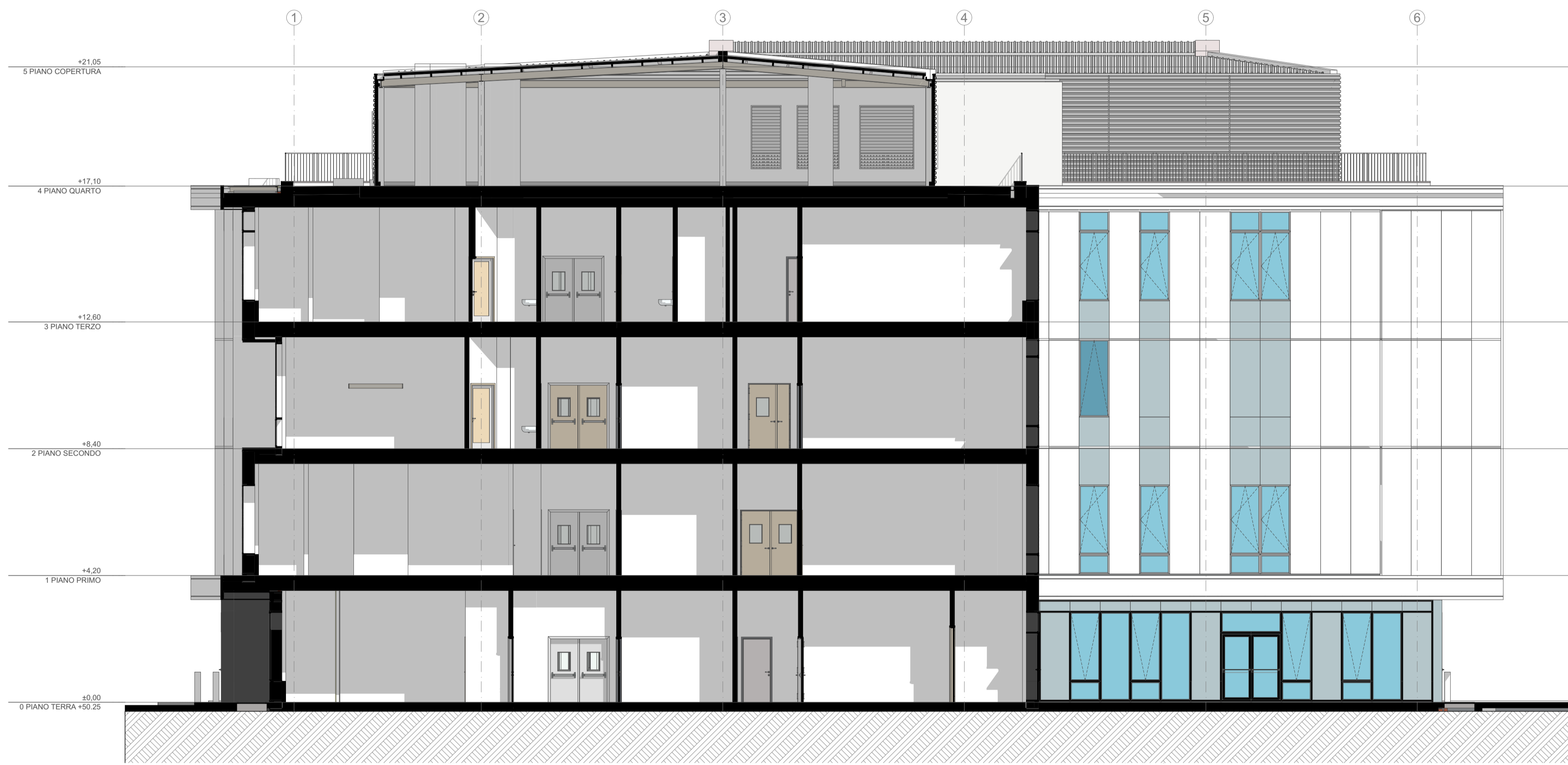
prospetto nord-est 02