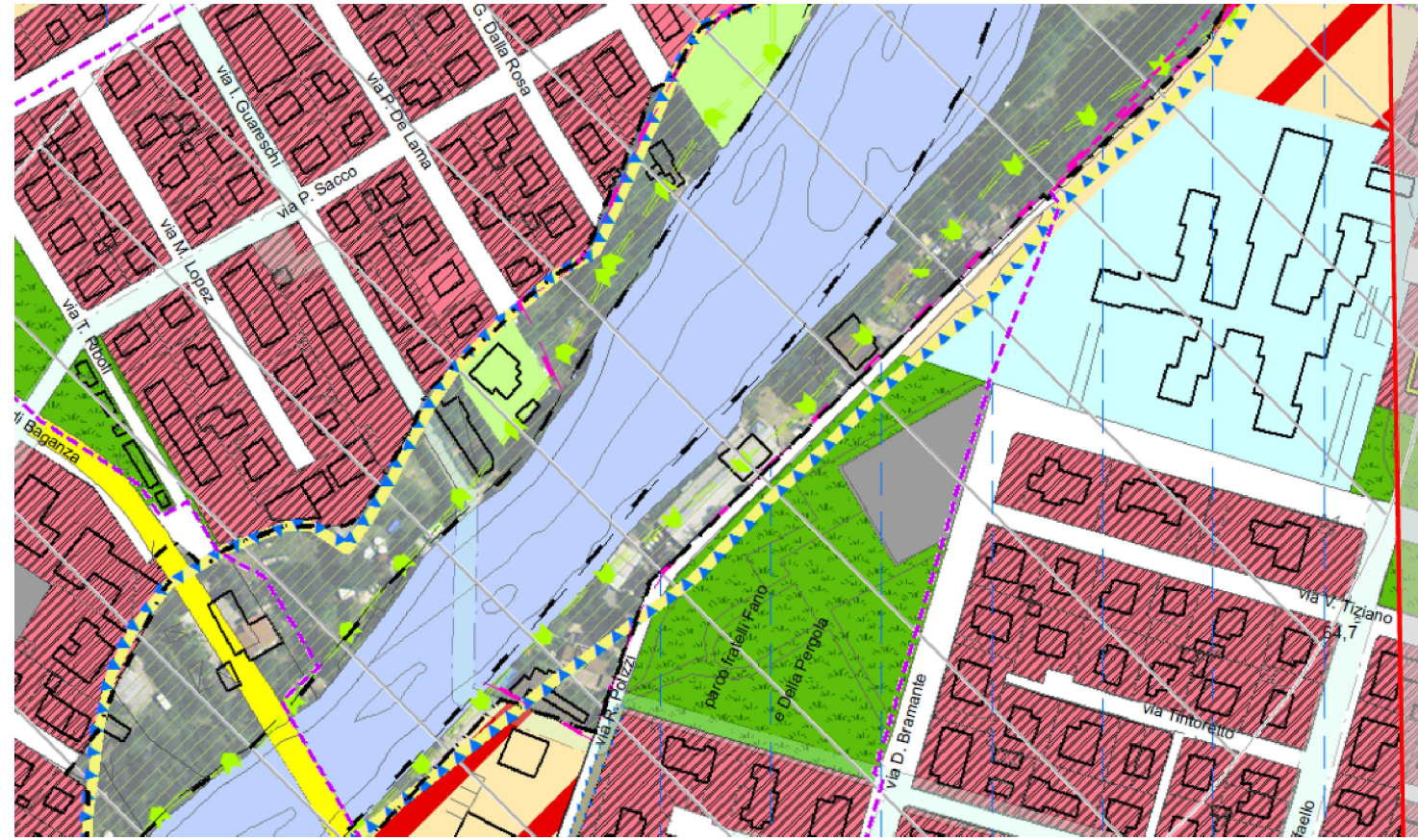
STRALCIO RUE TAV. 28-II-A