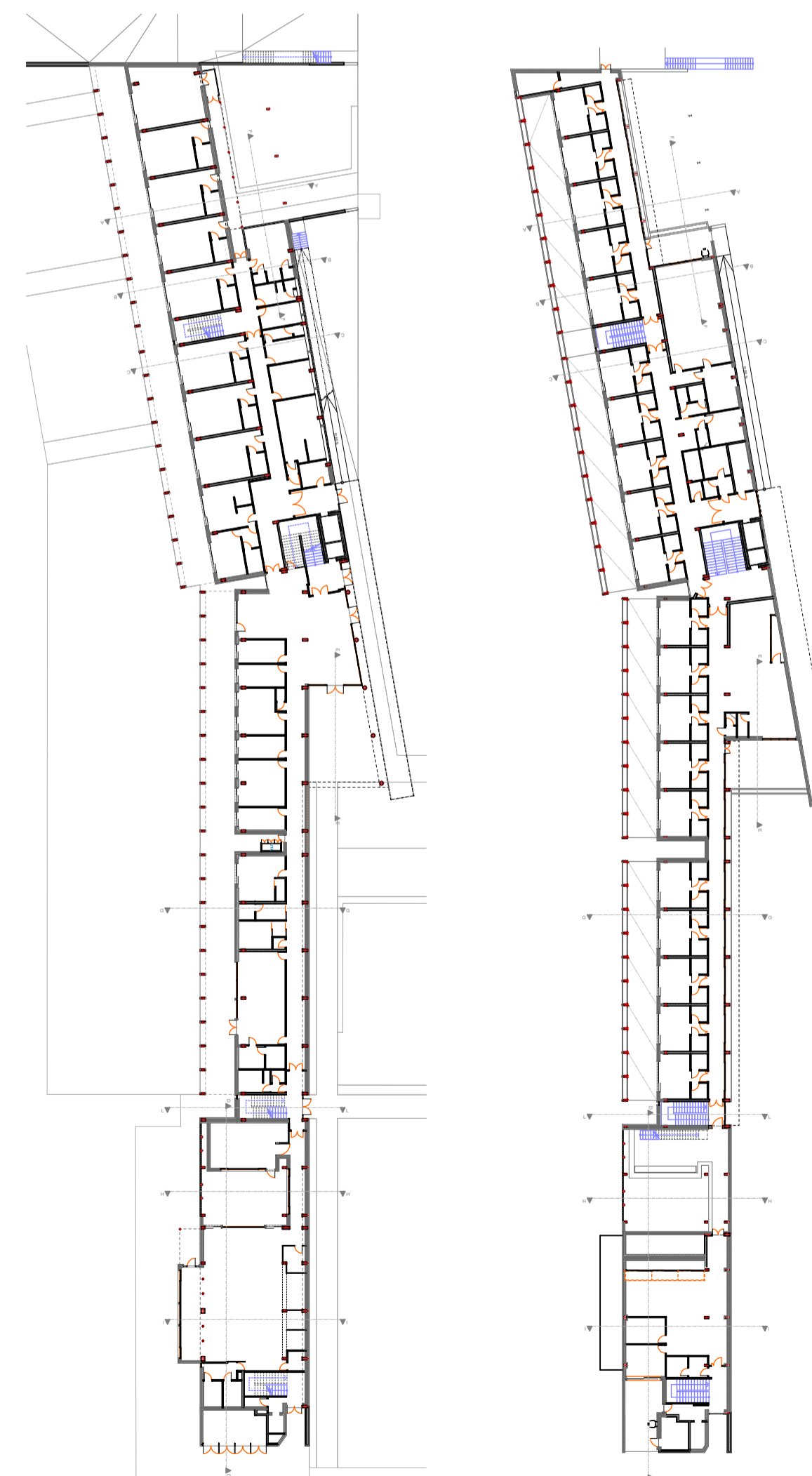
KEYPLAN STATO DI PROGETTO