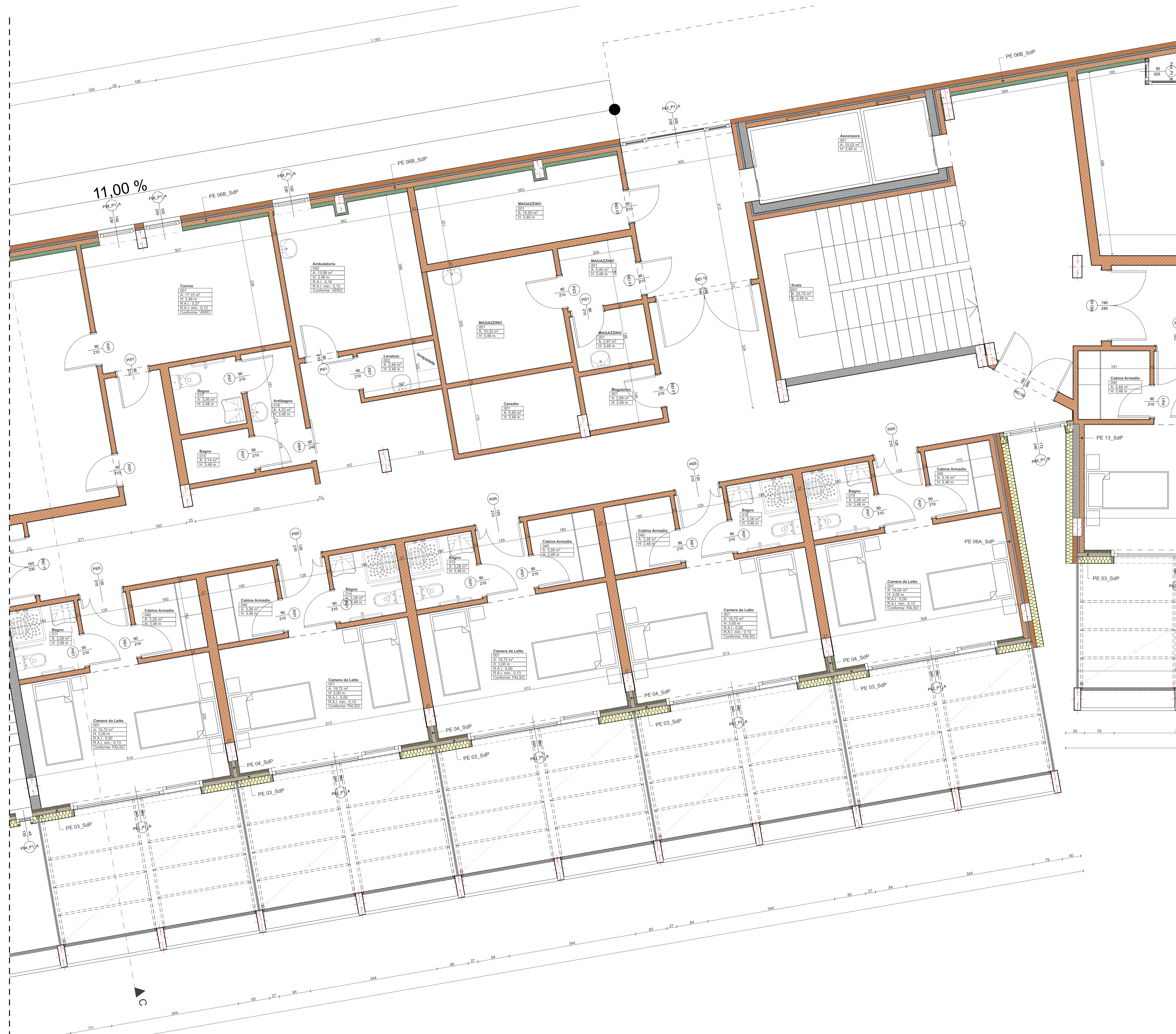
PLANIMETRIA PIANO PRIMO - BLOCCO A2 STATO DI PROGETTO - Scala 1:50