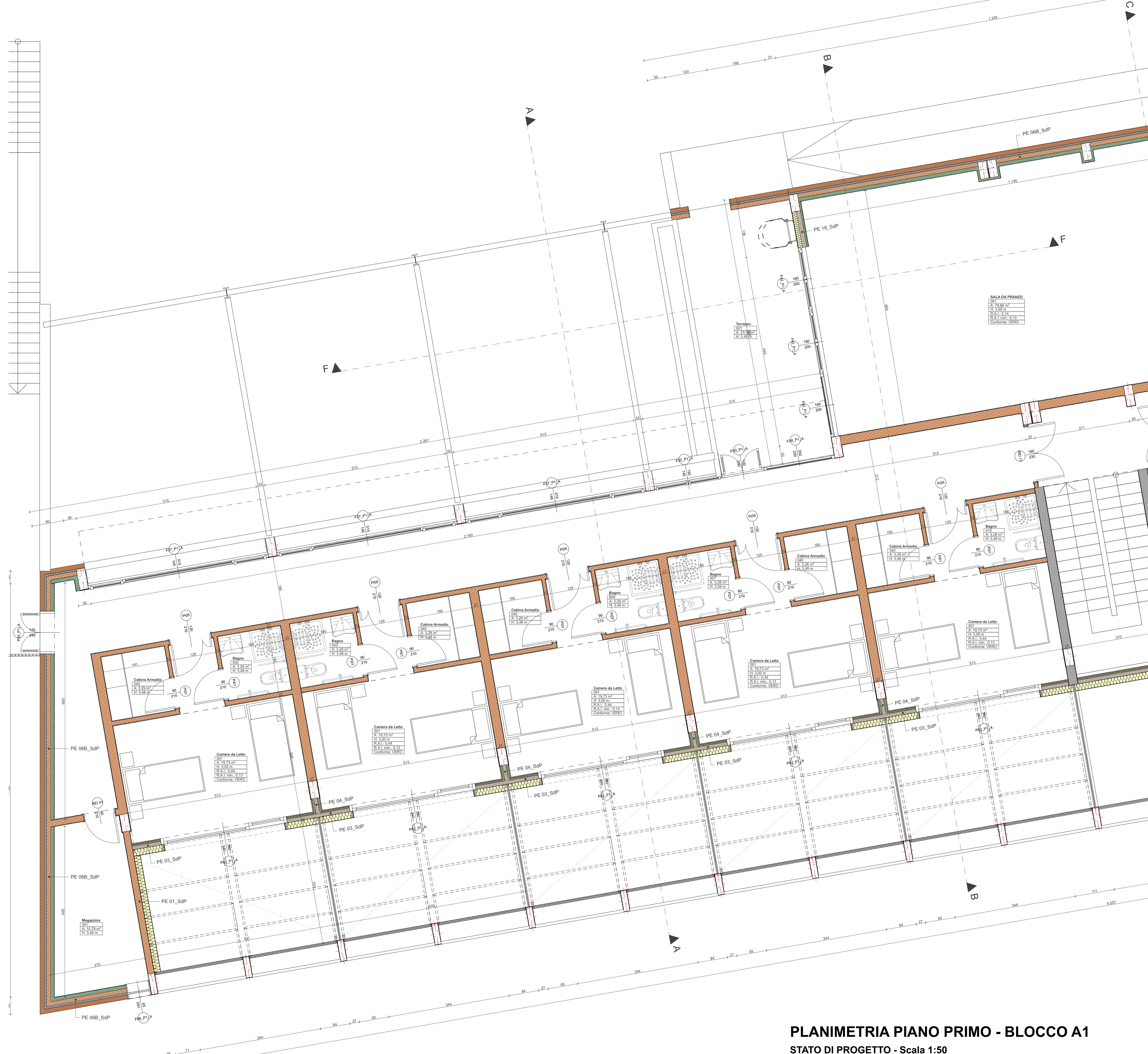
PLANIMETRIA PIANO PRIMO - BLOCCO A1 STATO DI PROGETTO - Scala 1:50