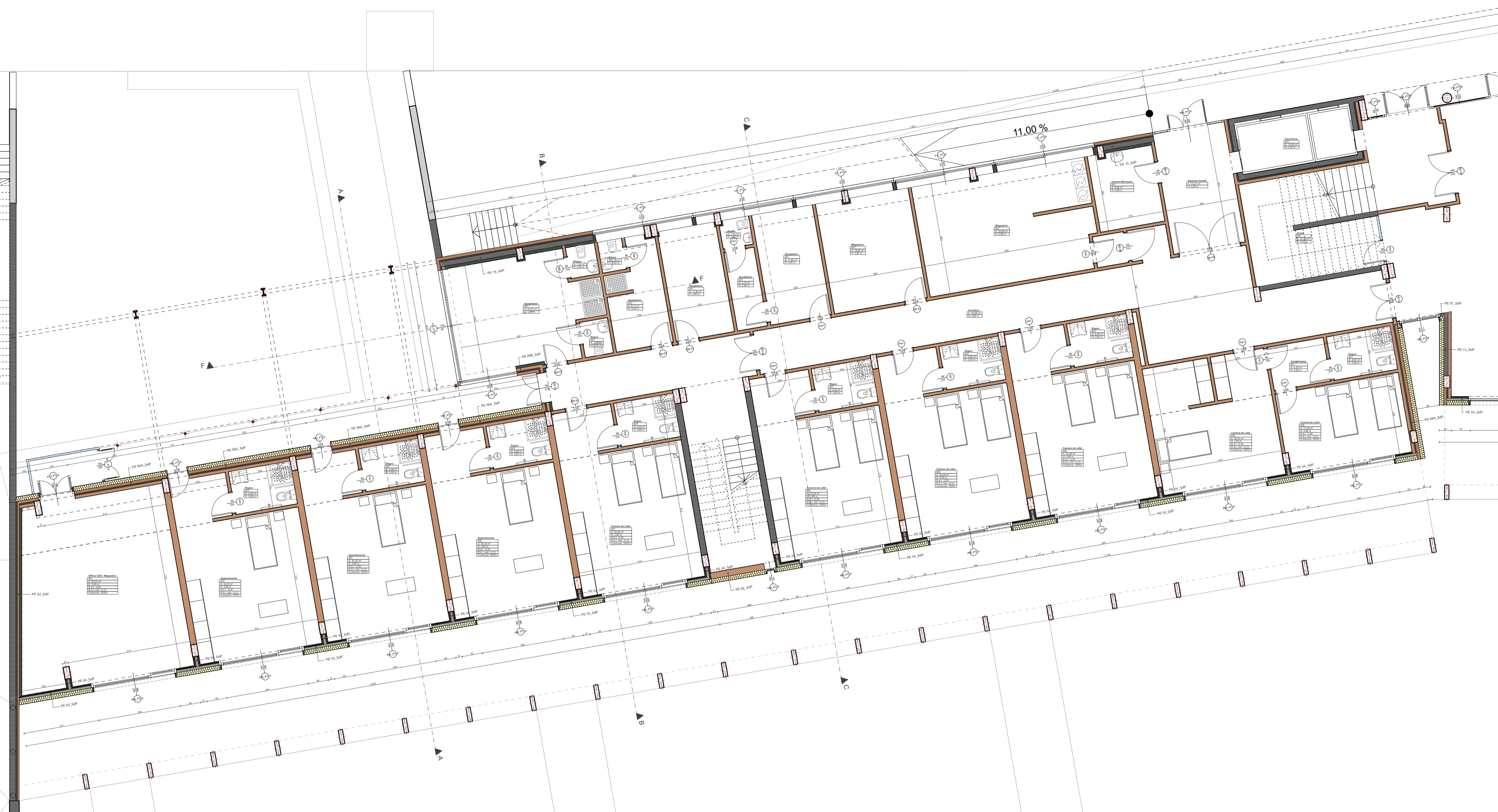
PLANIMETRIA PIANO TERRA - BLOCCO A STATO DI PROGETTO - Scala 1:100