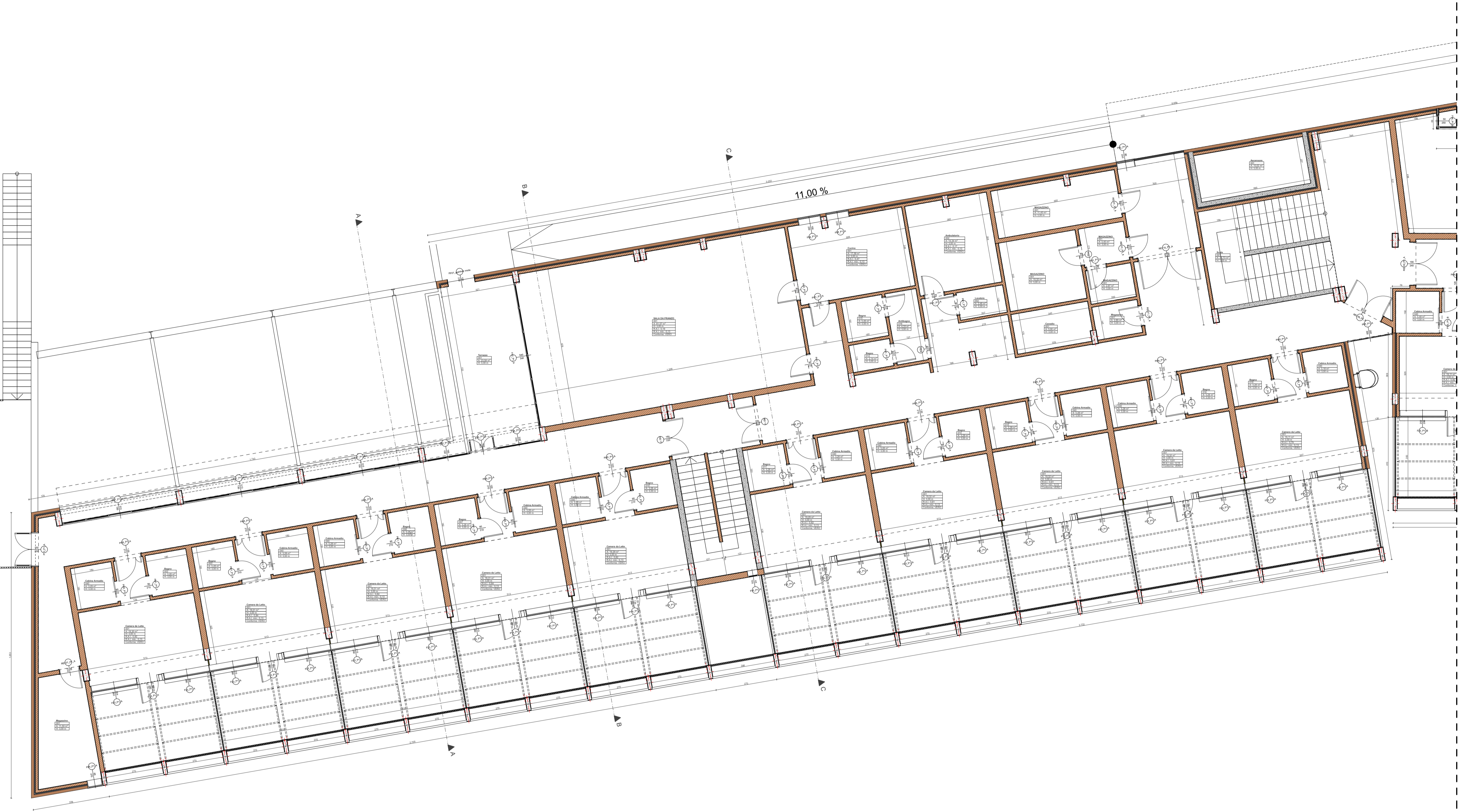
PLANIMETRIA PIANO PRIMO - BLOCCO A STATO DI FATTO - Scala 1:100